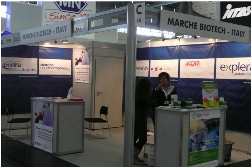
(g)/(h) Altre immagini dello stand, con particolari relativi ai visitatori interessati a conoscere la nostra associazione