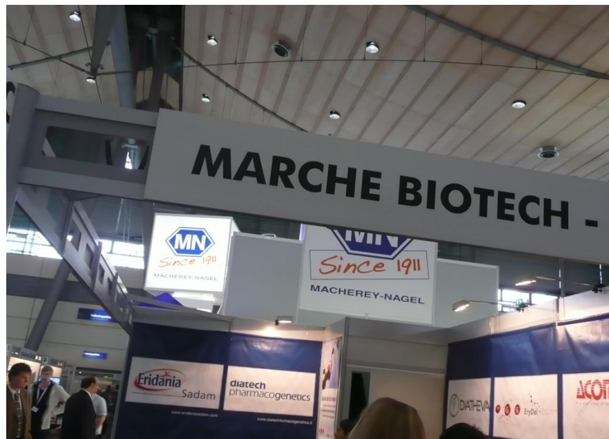
(e)/(f) Focus sullo stand dell'Associazione Marche Biotech, allestito con banner dimostrativi e materiale promozionale