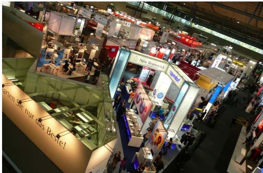
(c)/(d) Panoramica degli stand allestiti all'interno della Fiera Biotechnica