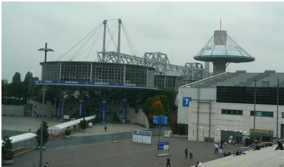
(a)/(b) Panoramica della struttura localizzata in zona Deutsche Messe dove era ubicata la Fiera